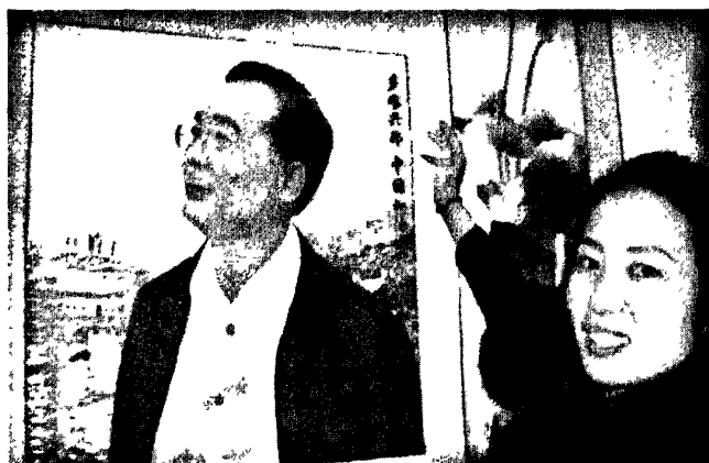
图6·3·2：观音绣《总理告别北川老县城》

从整体上来看这幅绣品长70厘米、宽65厘米，气势十分宏大。毫不夸张地说，观音绣《总理告别北川老县城》集悲、壮、凄、美于一体，并把观音绣刺绣艺人们卓越的艺术功底和神圣的社会责任感充分体现了出来。整幅作品通过鲜明的形象，获得了感人至深、催人泪下，令人肃然起敬的审美情感体验。观音绣《总理告别北川老县城》的美学特点是构思精巧、严谨，构图紧密、错落有致，针法整齐，线条流畅，做工精细，色彩鲜明，形象生动，立体感很强。该纹样上温家宝总理正凝视着眼前的一片废墟，神情非常焦虑，也很镇定，在温总理那无比坚毅的目光里升华出了对灾区人民的关切之情。整幅作品右上方