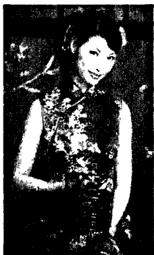
图7·3·3：刺绣在旗袍中的运用范例

讲到刺绣服装就离不开旗袍。刺绣的重要性体现在它是旗袍不可或缺的主要工艺之一，刺绣在旗袍工艺上应用得比较广泛：一般通过配色的方法，运用单色绣、同色绣、彩色绣和光泽色绣等绣品种类和技法，精心把精美的花鸟、龙凤呈祥、福、寿字等绣制上去，从而把迷人的东方色彩充分赋予了旗袍。