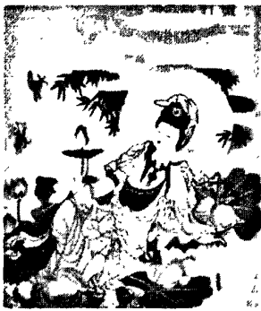
图 4·1·3·1: 卧莲观音