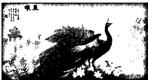
图 2·2·3·1：粤绣代表作——晨曦

针法，为了达到良好的艺术效果，常采用织金锻或钉金绣法衬地。粤绣因布局满、图案繁茂、场面热烈、用色富丽、对比强烈、大红大绿而著称于世。粤绣因构图丰满，空隙很少，即使出现空隙，也要用山水草地树根等补充，因而显得热闹而紧凑，繁而不乱。粤绣造型工整，色彩富丽，常通过夸张处理来取得强烈的对比效果。粤绣不仅光彩夺目，而且针法均匀多变，纹理分明，作品因多使用浓郁的奇彩原色及光影变化而具有西方绘画韵味，并通过丝线、绒线、孔雀毛绩、马尾缠绒等多样形态的用线等因素来强化。水路是粤绣运用的独特技法，可以取得图案层次分明，和谐统一的艺术效果。粤绣按刺绣技艺可分为丝线绣、金银线绣、双面绣、垫绣等品种。粤绣绣品品种丰富，都有极强的实用性和观赏性。现在我们一起欣赏一幅粤绣的代表作品：