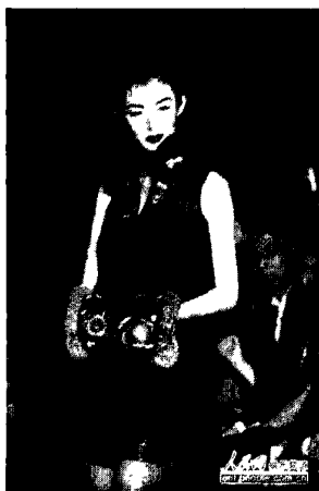
图7·3·2：四川羌绣在服装上的运用范例

该作品同样体现了让刺绣（羌绣）艺术通过服装这一世界性的载体而走向世界一条可资借鉴的成功之路！