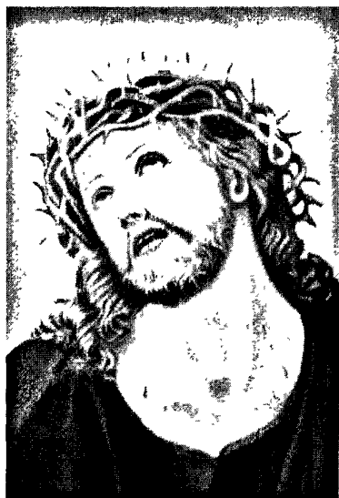
图 2·2·1·2：沈寿仿真绣代表作——耶稣像

种典型的中西方相结合的艺术。由于南通仿真绣在用线、针法、明暗搭配等方面具有传统苏绣所不及的优越性，从而成功地赋予了刺绣作品由于变化莫测、立体感强以及视角不同所带来的不同的审美体验。总之，强烈的仿真艺术效果是南通仿真绣艺术作品所具有的最突出的美学特色。沈寿（1874年—1921年）是南通仿真绣的创始人，《耶稣像》、《女优贝克像》、《蛤蜊图》等都是其著名的仿真绣作品。现附沈寿的一幅仿真绣作品：