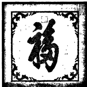
图 3·3·1: 福字片

观音绣中福字片同传统福字纹样一样也体现了祈福纳祥的寓意。福字纹样右下端未封口，寓意万福源源不断，福气高照，好运连连。