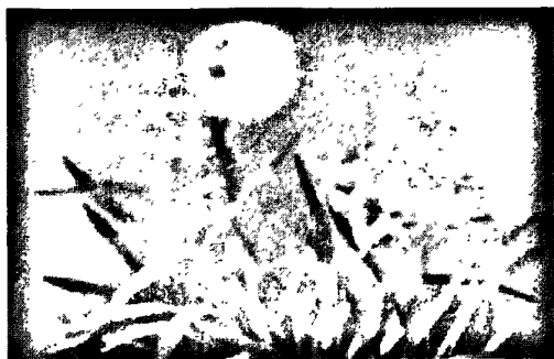
图 3·2·1: 兰草图

具四清——气清、色清、神清、韵清，给人留下了极高洁清雅的优美形象。因此，古今名人对它品评极高，常把它誉为花中君子。于是，古代文人们常把诗文之美比喻成兰章，把良友比喻成兰客，把友谊之真比喻成兰交。