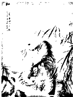
图 2·2·2·1: 湘绣代表作——饮虎

《饮虎》这幅绣品以中国画的表现形式，再现下山虎临于溪边草泽之中，即将饮水的场景。颇有山鸣谷应声，威壮雨啸风的意境。因采用湘绣独创的鬃毛针法绣制，使老虎毛色柔美中显刚劲。整幅作品形象生动、逼真，质感强烈。