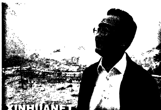
图6·3·1：新闻图片《总理告别北川老县城》