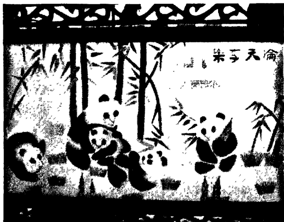
图 4·5·3·1: 乐享天伦

这幅作品画面平滑，熊猫的眼神举止形象逼真，其诱人的憨态跃然于纸上，做工相当细腻。在用色方面，将竹子的绿色与熊猫的白色、黑色有机结合，色彩明快。再配以“乐享天伦”的文字纹样，竹子又寓意平安，托物言志，寓意深刻，更显得匠心独具、浑然一体，让人见了爱不释手。