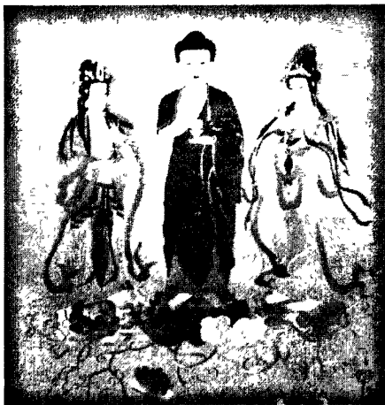
图 4·2·2·1: 西方三圣

众所周知，“西方三圣”，就是西方极乐净土世界的阿弥陀佛，以及他的左胁侍观世音菩萨和右胁侍大势至菩萨。阿弥陀佛，汉译又称无量寿佛，是西方极乐世界的教主。阿弥陀佛是代表无量光明，无量的寿命，无量的功德。观音菩萨是代表大慈悲，宇宙的大慈悲。大势至菩萨是代表喜舍。纵观西方三圣像，阿弥陀佛在中间，东边和西边分别是观音菩萨和大势至菩萨，所以在我们地球的东方，是观音菩萨的道场，西方就是大势至菩萨的道场。他们都置身于莲花之上，代表了圣洁，象征了西方的净土，佛教气息十分浓郁。这幅作品构图饱满，人物排列主次分明、疏密得体，立体感和平衡美感极强。