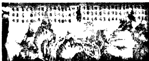
图 3·3·2: 观音赐百福