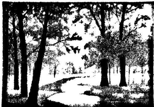
图 3·2·2: 怀秋图

怀秋图这幅作品写实与写意相结合，通过秋之色（树叶的色彩）以及秋之水（林间小河）等景物层次的渲染和烘托，表达出了浓浓的秋意——令人陶醉的秋的神韵！