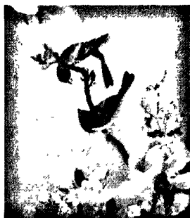
图 2·2·1·1: 苏绣代表作

作为以江苏苏州为生产中心的地域性刺绣品种的苏绣,其主要特点是齐、光、直、匀、薄、顺、密。齐指图案边缘齐整;光指光彩夺目,色泽鲜明;直指绣面平展;匀指线条精细均匀,疏密一致;薄指用料质地轻盈;顺指丝理圆转自如;密指线条排列紧凑,不露针迹。地方特色浓郁的苏绣的独特风格是图案秀丽、构思巧妙、绣工细致、针法活泼、色彩清雅。苏绣作品可以分为日用品与观赏品两大类,其中日用品有被面、靠垫、衣、裙、鞋及佩饰小品等;观赏品包括屏风、台屏、挂屏、册页等,兼备装饰性与实用性。苏绣的技法以平绣、乱针绣、精微绣和双面绣为主,其中以双面绣作品最为精美。苏绣的针法有9大类、40余种,其中采用较多的针法有齐针、套针、抢针、乱针、打子、刻鳞等。苏绣作品的主要艺术特点是山水能分远近之趣、楼阁具现深邃之体、人物能有瞻眺生动之情、花鸟能报绰约亲昵之态。此外,苏绣的仿画绣、写真绣其逼真的艺术效果也是名满天下的。现在我们一起欣赏一幅苏绣的代表作品: