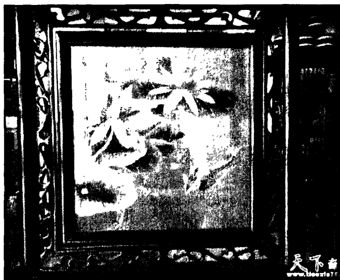
图 4·2·3·1: 年年有余

这幅观音绣作品的纹样是由莲花和鲤鱼组成的吉祥图案，借莲与连，鱼与余谐音，故称作连年有余。绣品中的鲤鱼、莲花均以成双成对的形式出现，表示对生活优裕、财富年年富余的愿望和祝愿。