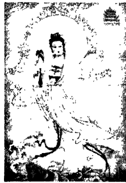
图 4·1·3·2: 骑鲤观音

这两幅观音绣艺术作品构图纹样十分随意，虽然都以传说中的种种观音为主体，但都借莲、龙、月、蝴蝶、竹等传统纹样构成了浑然一体的观音绣独特的纹样，尽管这些纹样看起来随意性很强，如：卧莲观音、骑龙观音、骑鲤观音、骑象观音等，但都恰如其分地表达了祈福纳吉的寓意。