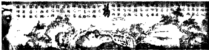
图 4·3·2·1: 观音赐百福

观音绣是蜀绣的一种，遂宁独特的观音民俗文化与刺绣传统的完美结合，这就使观音绣在纹样造型上就呈现出了鲜明的地域性特征。它取决于遂宁的自然环境，经济基础，民间习俗和文化传统等。如：观音赐百福正好完美地体现了观音绣在纹样造型上的地域性特征。应该着重指出的是中国观音文化首先是一种宗教文化，但在遂宁，观音文化早已民俗化了。于是大慈大悲的观音菩萨变成为了真、善、美的化身。观音赐百福这幅作品将观音文化（观音纹样）与中国传统文化（福字纹样）的完美结合，共同强化了中华民族祈福纳祥的传统寓意。充分体现了遂宁观音绣纹样造型的地域性特征。如：