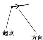
图 2 起点